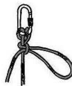
Demi cabestan et noeud de mule